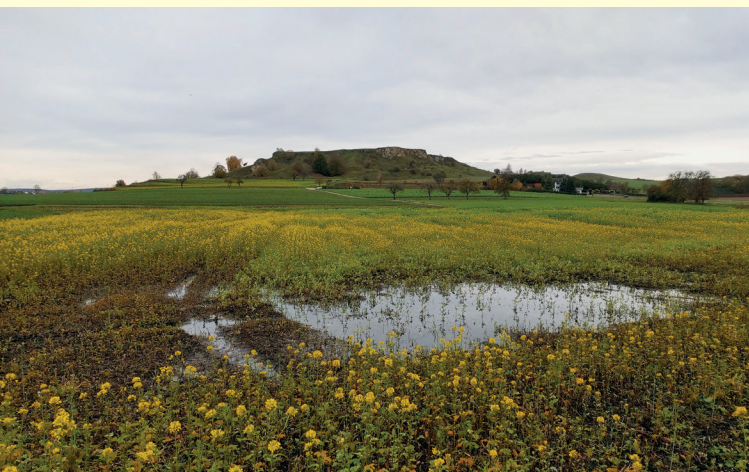
Degeneriertes Moor mit Ackernutzung. Im Zuge einer Flurneuordnung kann eine Renaturierung erfolgen.

Es bestehen bereits eine Bund-Länder-Zielvereinbarung zum Klimaschutz durch Moorbodenschutz und ein Moorschutzprogramm Baden-Württemberg. Gemäß dieser sollen trockengelegte Moore wiedervernässt werden, um natürliche Kohlenstoff-Speicher entstehen zu lassen. Außerdem sollen die noch vorhandenen Moore dauerhaft geschützt werden.