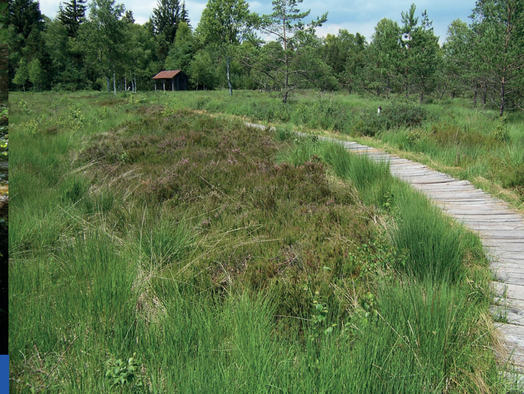
Bohlensteg im Wurzacher Ried. Für ökologische Aufwertungen wurden in Bad Wurzach mehrere freiwillige Landtausche durchgeführt.