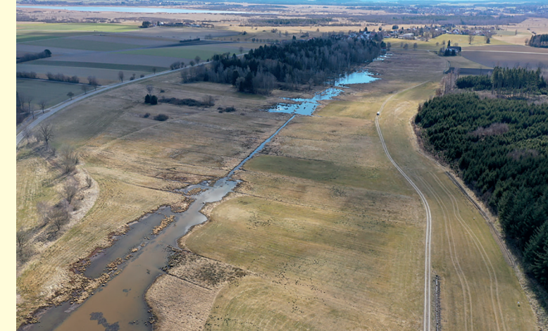
Natürliche Wiedervernässung wird auch vom Biber durch die aktive Gestaltung seines Lebensraums gefördert. Die Flurneuordnung hilft bei Flächenkonflikten zwischen Landnutzung und Naturschutz.

Weitere flankierende Maßnahmen der Flurneuordnung, wie z.B. Wegebau und Zusammenlegungen, gewährleisten dabei gleichzeitig eine Verbesserung für die Agrarstruktur im Umfeld der Moorschutzmaßnahme.