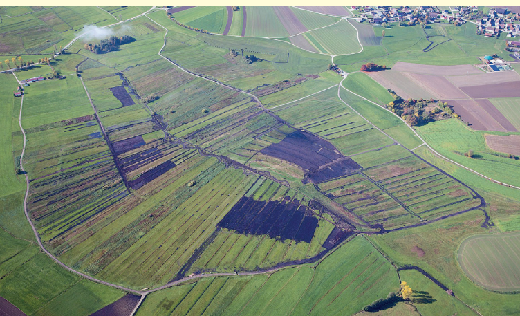
Erfolgreiche Revitalisierung im Nördlichen Federseeried im Flurneuordnungsverfahren Alleshausen/Seekirch.